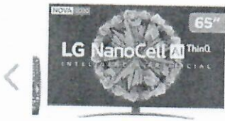
Smart TV 4K NanoCell IPS 65 LG