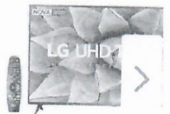
Smart TV UHD 4K LE IPS 55 LG 55UN7310