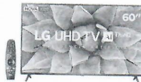
Smart TV 4K LED 60 LG 60UN7310PSA Wi-Fi