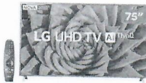
Smart TV 4K LED IPS 75 LG 75UN8000PSB Wi-Fi -